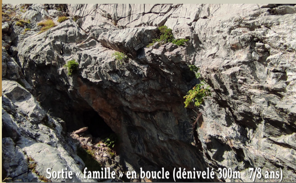
Sortie « famille » en boucle (dénivelé 300m 7/8 ans)

Jeudi 25 juillet Randonnée du Somport jusqu'à la mine de cuivre du Causiat