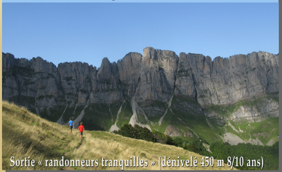
Sortie « randonneurs tranquilles » (dénivelé 450 m 8/10 ans)

Jeudi 15 août Randonnée de cabane en cabane dans le vallon glaciaire d'Azuns