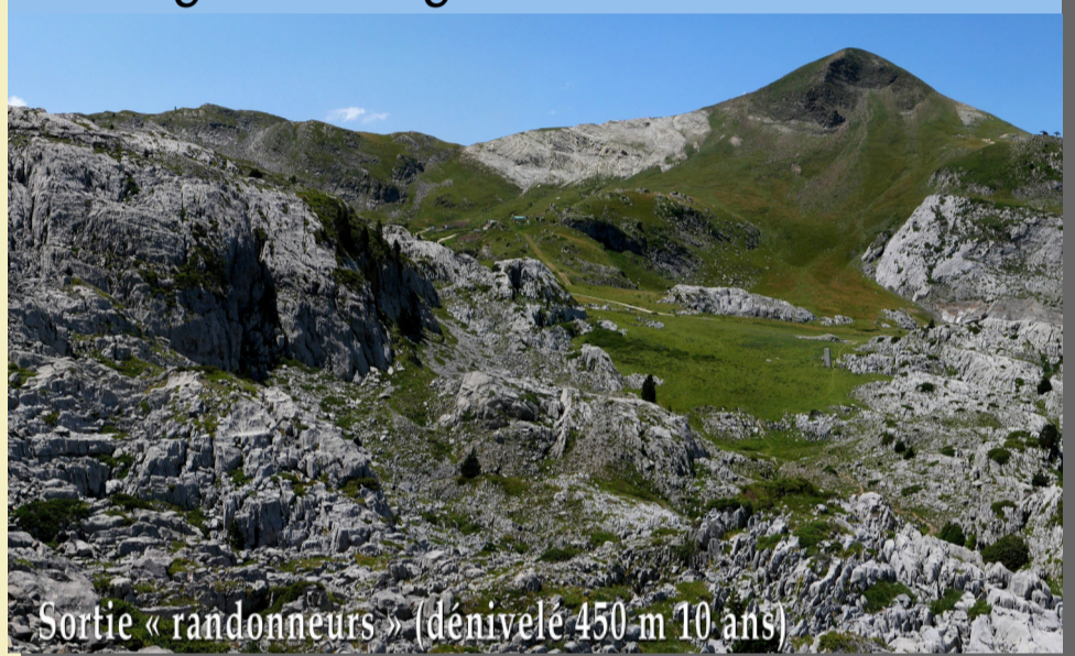
Sortie « randonneurs » (dénivelé 450 m 10 ans)

Jeudi 1er août Randonnée sur le karst en longeant des gouffres