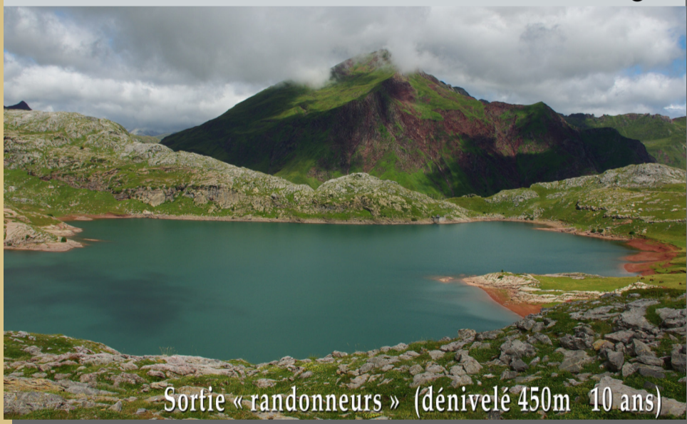
Sortie « randonneurs » (dénivelé 450m 10 ans)

Jeudi 8 août Randonnée au lac d'Estaëns dans son écrin de roches rouges