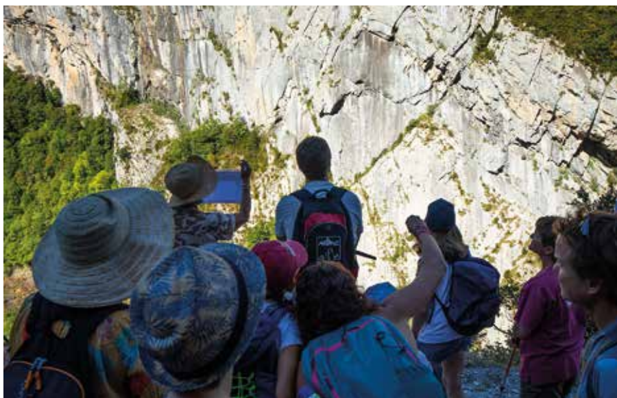
En 2020, sur le chemin de la Mâtre, lors d'une randonnée organisée par Géolval depuis l'ancienne gare d'Etsaut qui abrite aujourd'hui la maison du parc national des Pyrénées.