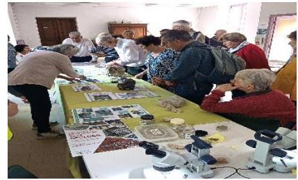
Exposition à la maison Gascoin