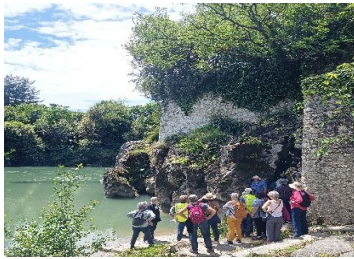
au bord du Gave