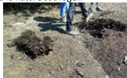
Bois fossile Arjuzanx