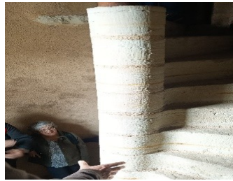
L'escalier en dalles de flysch de la maison d'Albret