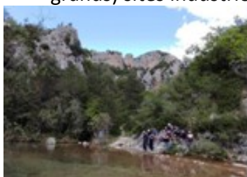
Barranco de la Pilara